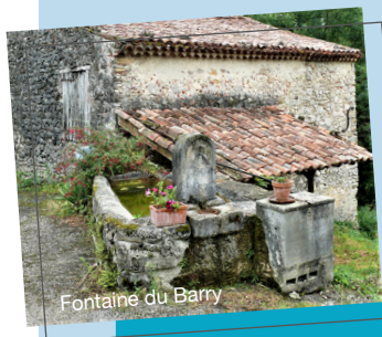
Fontaine du Barry